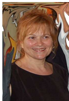
La Presidente Benedetta Sereno Clerici

Chi entra per la prima volta al centro alcune volte pensa che quei momenti di silenzio di un ragazzo siano eterni e non abbiano significato, ma dopo averci iniziato a frequentare si accorge di quanto quei silenzi siano frutto di tanto lavoro fatto in equipe dentro e fuori il centro.